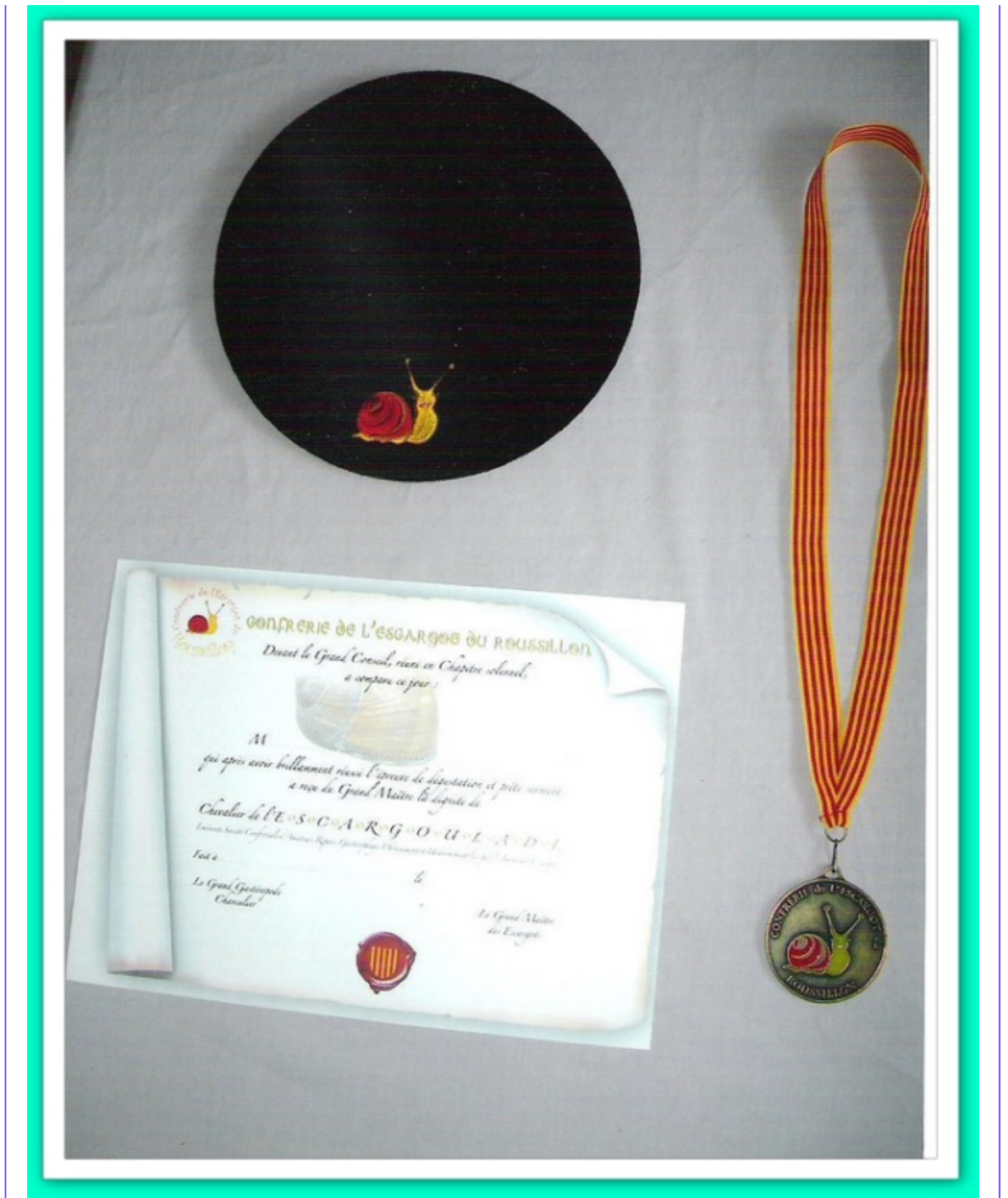
Albums Photos souvenirs