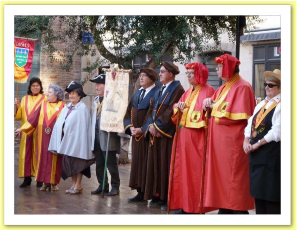
Grand Chapitre 2016