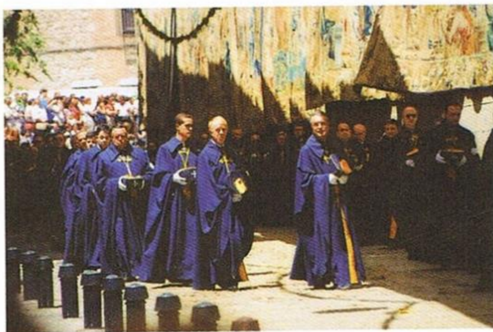
Confrérie des Mazarales.