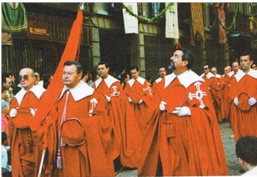
Confrérie Infanzones de Illescas.