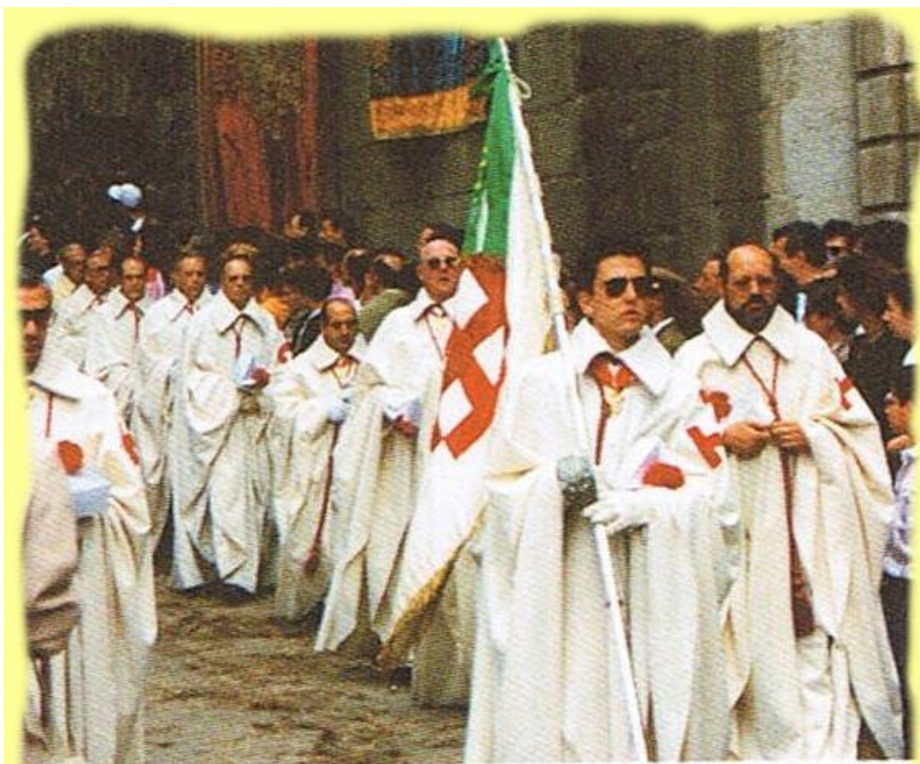
L'Ordre des Chevaliers du Saint Sépulcre.